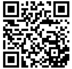
必携パソコンの案内

概要: 金沢大学では学生生活に関わる主な連絡や手続きはオンラインで行っており、ポータルサイトにログインすることで、履修登録・各講義の担当教員との連絡・e-learning 教材を用いた自習・レポート提出・成績確認、更には健康診断結果の確認や進学・就職支援に至る学生生活全般に関する情報の取得が可能です。ノートパソコンは授業でも活用され、1年次第1クォーターに開講される全学必修科目「データサイエンス基礎」で上記に記載した大学でのパソコンの利用方法を学んだ後、学部4年間を通じて、卒業論文を執筆するまで利用することを前提としています。そのため、特別な事情がない限り、入学時までにはノートパソコンを準備してください。