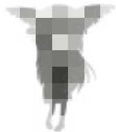
Azamiちゃん 総合メディア基盤センター 公認マスコット

この教室は、主にPBL (Problem Based Learning) 型の授業に使用されます。