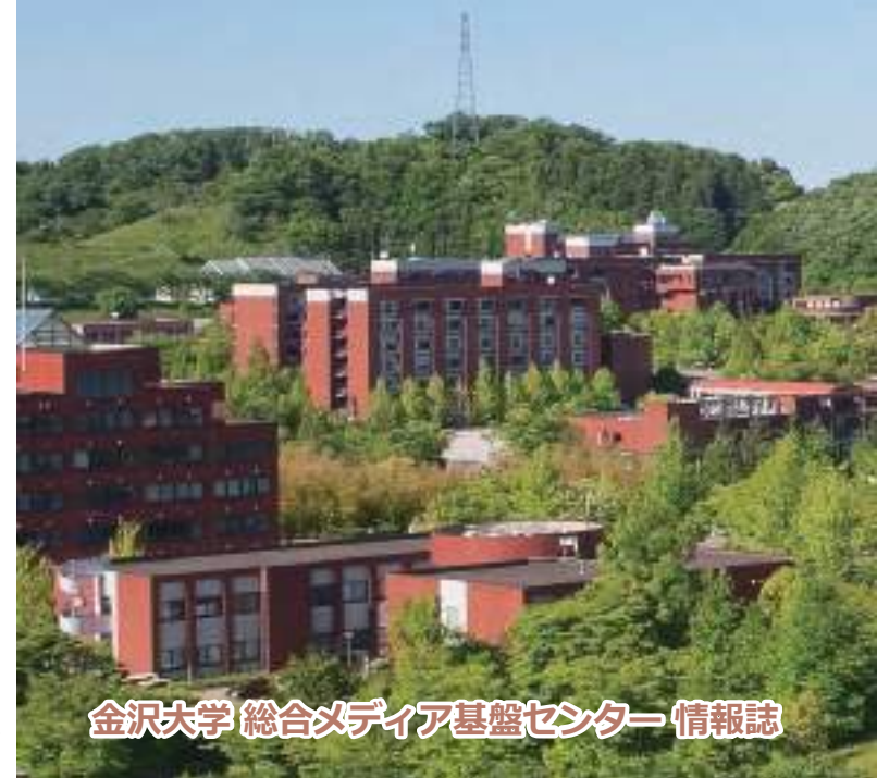
金沢大学 総合メディア基盤センター 情報誌